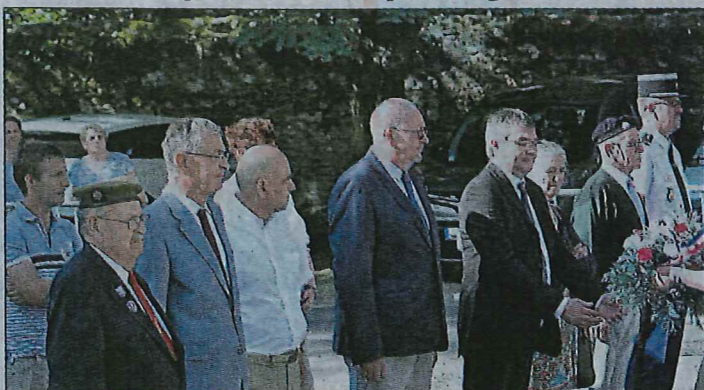
■ Les autorités lors de la cérémonie du 14 Juillet.

Après avoir souligné l'incidence possible des coupes budgétaires sur la désertification mé-